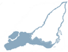
Tableau synthèse des principaux résultats de l'enquête auprès des élèves de 6e année du primaire selon les voisinages CIUSSS de l'Ouest-de-l'Île-de-Montréal